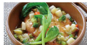
③豆腐のベジバーグ