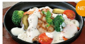
④信州みゆき豚のグリル クリームソース