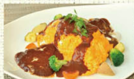
②おひさまオムライス (デミグラスソース)