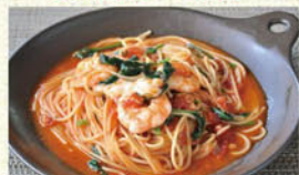
⑦青菜と海老のトマトソーススパゲティ