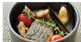
②白身魚のアクアパッツァ