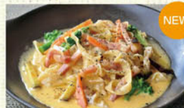
⑨冬野菜のカルボナーラ