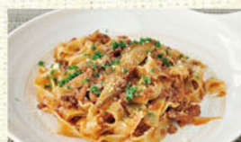
⑥ごぼうのポロネーゼ