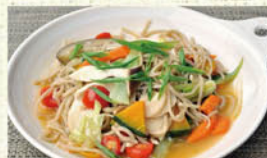
⑧自家製手打ちそばパスタ