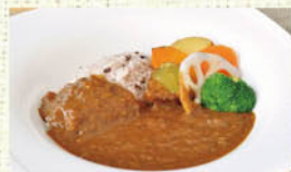
③さわらび雑穀カレー ※白米に変更できます