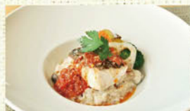
④白身魚と十五穀米の 豆乳ヘルシーリゾット