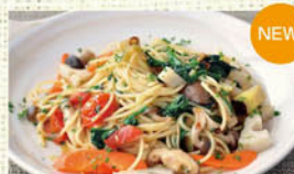
⑤冬野菜のペペロンチーノ