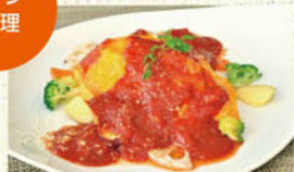
①おひさまオムライス (トマトソース)