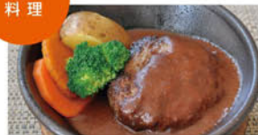
①信州牛100%のハンバーグ